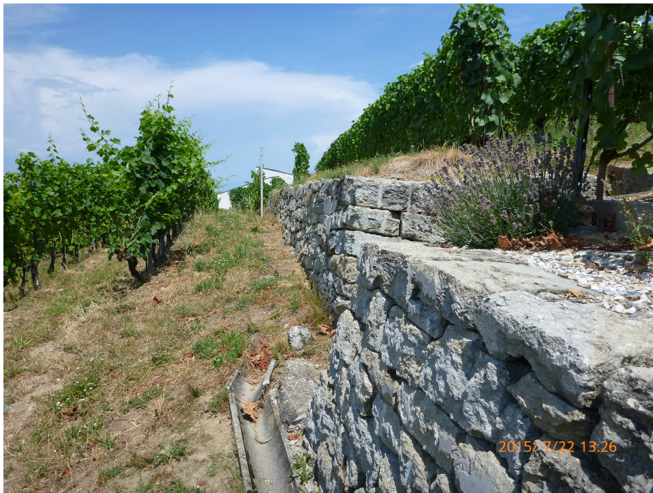
Photos de l'objet 22.07.2015